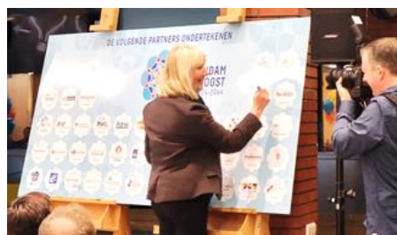
Ondertekening van het Pact Zaandam-Oost (januari 2024)

Op lokaal gebied is de samenwerking voortgezet onder andere met het sociaal wijkteam, met stichting Alwaan en met de overige partners in Pact Zaandam-Oost (dat loopt van 2024-2044).