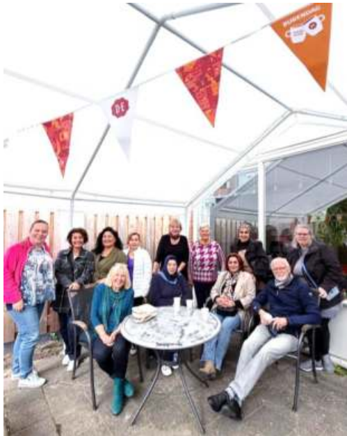
Burendag 2025 bij De Bron

Door meer samenwerking te zoeken met andere organisaties en bedrijven in de buurt, vergrootten we ook de naamsbekendheid van De Bron.