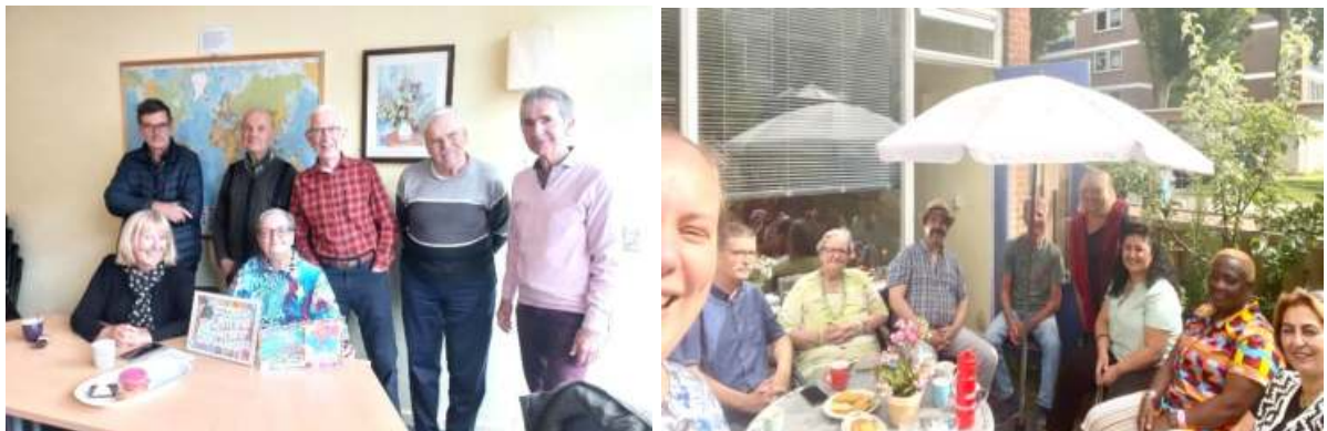
Foto's van inloopbijeenkomsten. Niet alle bezoekers willen op de foto, waardoor het aantal bezoekers hoger kan liggen dan u op beeld ziet.

“Ik kijk iedere dag uit naar het moment dat ik weer naar De Bron en het Lobeliaatje (de tweede locatie) kan komen. Ik hoef nu niet meer te werken waardoor ik minder mensen zie. Hier kan ik fijn met mensen blijven praten en luisteren. En voor mijn verjaardag hadden ze een prachtige verrassing gemaakt. Dat doet me goed!”