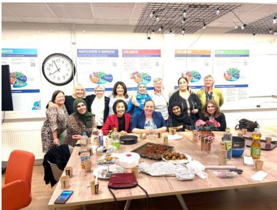
Één van de groepen die een iftar organiseerde

“Ik kwam om de Nederlandse taal te leren. Ik leer dat en ik heb hierdoor vriendinnen gekregen. Zij wonen in de wijk, maar komen uit heel de wereld. Wij doen nu ook dingen samen, zoals samen eten en leren over elkaar.”